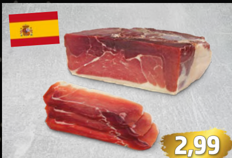
SERRANO SCHINKEN original luftgetrockneter Rohschinken aus Spanien, eine Delikatesse, €/100g