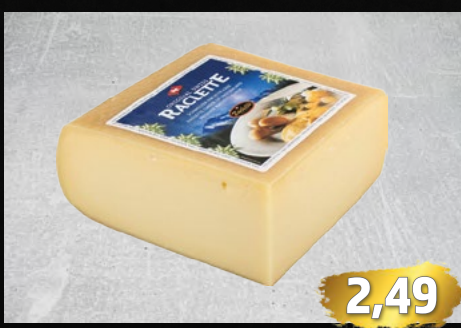
SCHWEIZER RACLETTE NATUR Schweizer Schnittkäse, mind. 45% Fett i. Tr., würzig, ausgewogen, €/100g