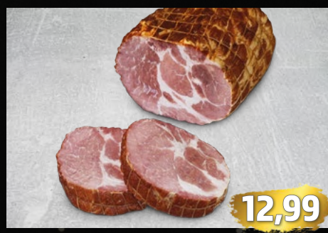
RÖMERBRATEN vom Schweinehals, zart und aromatisch, ideal für ein herzhaftes Essen, €/kg