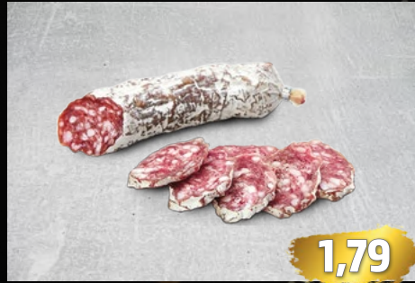
CHASSEUR JÄGERSALAMI luftgetrocknet, 200-g-Stücke, aus bestem Schweinefleisch, €/100g