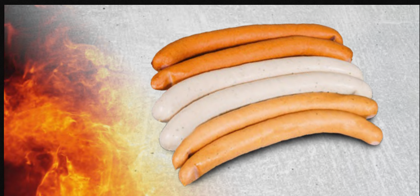
GRILLWÜRSTCHEN WEISS, ROT oder KÄSE die Klassiker für Grill und Pfanne, €/100g