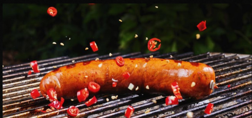
KÄSE-CHILI-LYONER traditionell hergestellt, feurig im Geschmack, €/100g