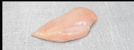
HÄHNCHENBRUSTFILET lecker und eiweißreich, natur oder pfannenfertig gewürzt, HKL A, €/kg