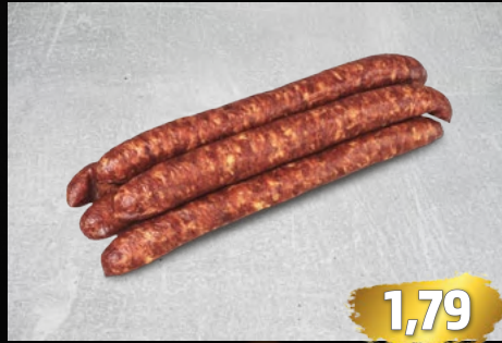
ROHESSER knackig im Biss, lecker im Geschmack, €/100g