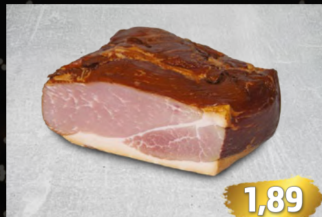
SCHINKENSPECK gold-gelb geräuchert, herzhaft deftig, €/100g