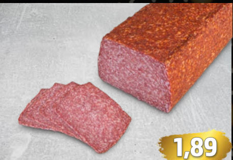
HAUSSALAMI traditionell hergestellt, würzig im Geschmack, €/100g