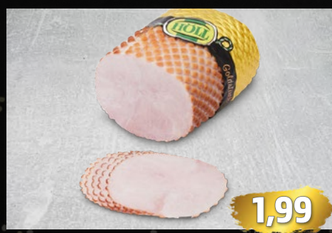
UNSER GOLDSTÜCK herzhaft geräucherter Kochschinken der Premiumklasse, €/100g