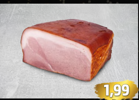
BACKSCHINKEN nach Münchner Art, besonders saftig, mild geräuchert €/100g