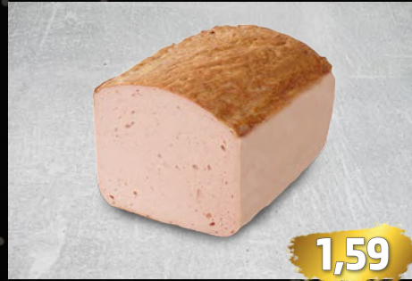
FLEISCHKÄSE ofengebacken, original saarländisch, als Aufschnitt oder dicke Scheiben, €/100g