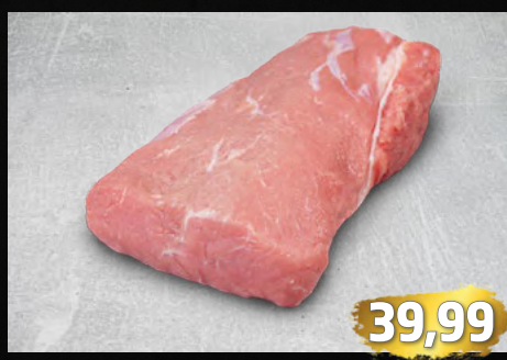
KALBSRÜCKEN mit feiner Fettmarmorierung, besonders zart und mager, €/kg