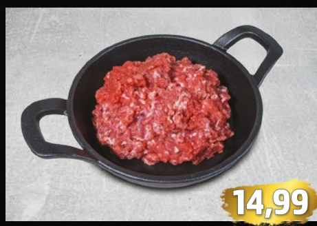
RINDERHACKFLEISCH laufend frisch hergestellt, €/kg