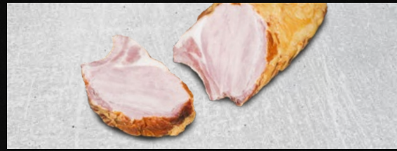
KASSELER STIELKOTELETT vom Schwein, mit Knochen, gold-gelb geräuchert, mild gesalzen, €/kg