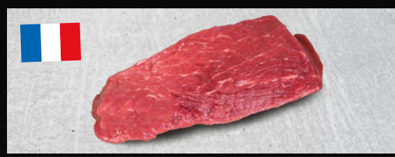
RINDERHÜFTSTEAKS aus Frankreich, gut abgehangen, zart und mager, ideal zum Raclette, €/kg